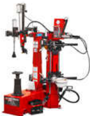
TCX70 mit Airschock