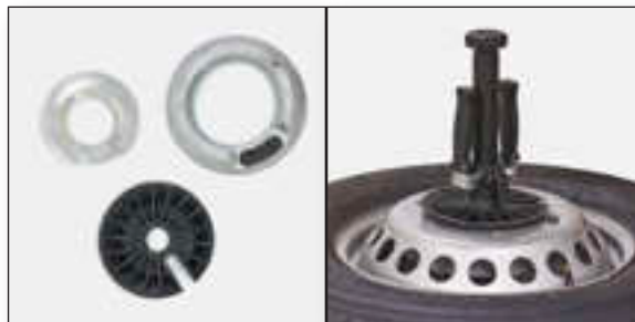
Lkw Adapter – RP11-8-11100417

Mit einem starken Luftdruck wird der Wulst an die Felge gepresst.