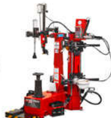
TCX70 mit Airschock und Reifenlift